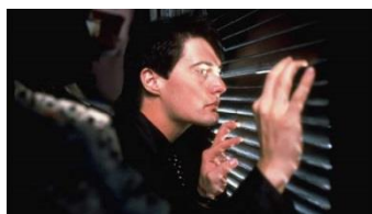
David Lynch: «Blue Velvet», 1986, Filmstill Booklet: S. 42f.