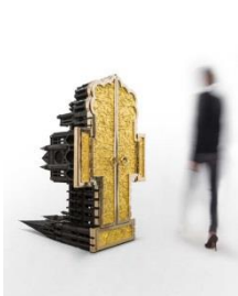
Studio Job: «CHARTRES (Aftermath)», 2009– 2012 Booklet: S. 3

Per Ausstellungsöffnung folgen weitere Medienbilder mit Impressionen aus den Ausstellungsräumen.