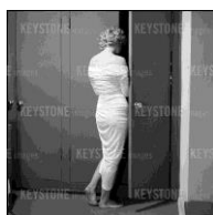
Marilyn Monroe, 1952.