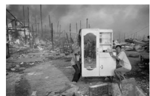
John Vink: «Cambodia, Phnom Penh, Bassac Slum Fires», 2001 Booklet: S. 21