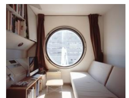
Nortiaka Minami: «1972», seit 2010 © Nortiaka Minami Booklet: S. 20