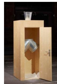
Roman Signer: «Hose», 2016, Courtesy Häusler Contemporary München-Zürich, Foto: Nick Ash Booklet: S. 34f.