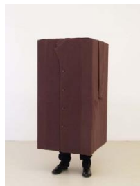
Erwin Wurm: «Hypnose II (Mantel)», 2008, Foto: Studio Erwin Wurm Booklet: S. 30f