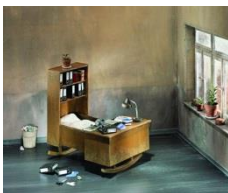
Frank Kunert: «Büroschlaf», 2010, © Frank Kunert Booklet: S. 38