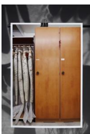
Lorenz Cugini: «Preserved Goods», 2017 Booklet: S. 40