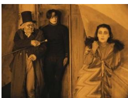
Robert Wiene: «Das Cabinet des Dr. Caligari», 1920, Filmstill Booklet: S. 42f.