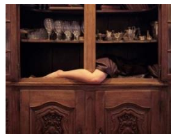
Julia Gröning: «Schrank 1», 2007, © Julia Gröning Booklet: S. 39/41