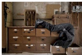
Augustin Rebetez: «Oiseaux», 2014, Filmstill, Courtesy Galerie Nicola von Senger, Zürich © Augustin Rebetez Booklet: S. 34f.