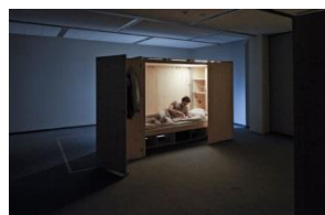
The next ENTERprise Architects: «HAWI-intervention II», Prototyp, 2016 Booklet: S. 13