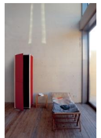
Jörg Boner: «Dresscode», 2004 Booklet: S. 18/19