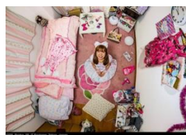
John Thackway: «My Room Project», seit 2010 Foto: John Thackway Booklet: S. 18