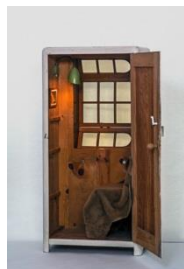
Regina Baier: «S1. Privates Gehäuse», 2012 Booklet: S. 37